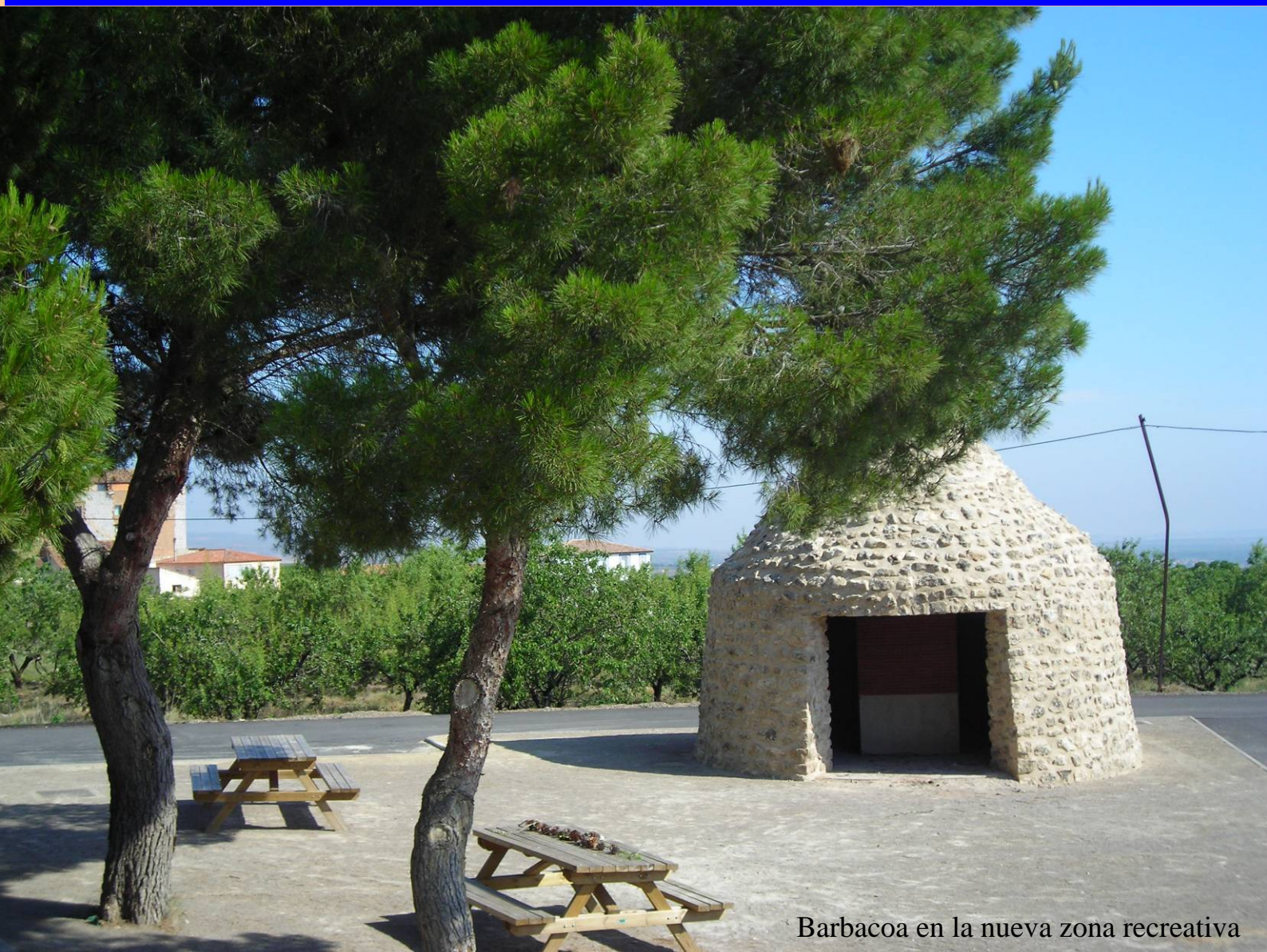
Barbacoa en la nueva zona recreativa