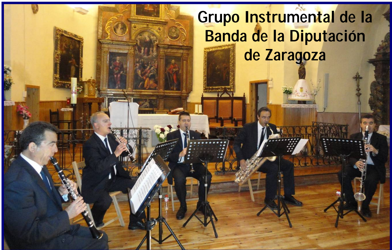
Grupo Instrumental de la Banda de la Diputación de Zaragoza

Domingo 26 de Julio. 12 h. Iglesia de Ntra. Sra. de la Asunción.