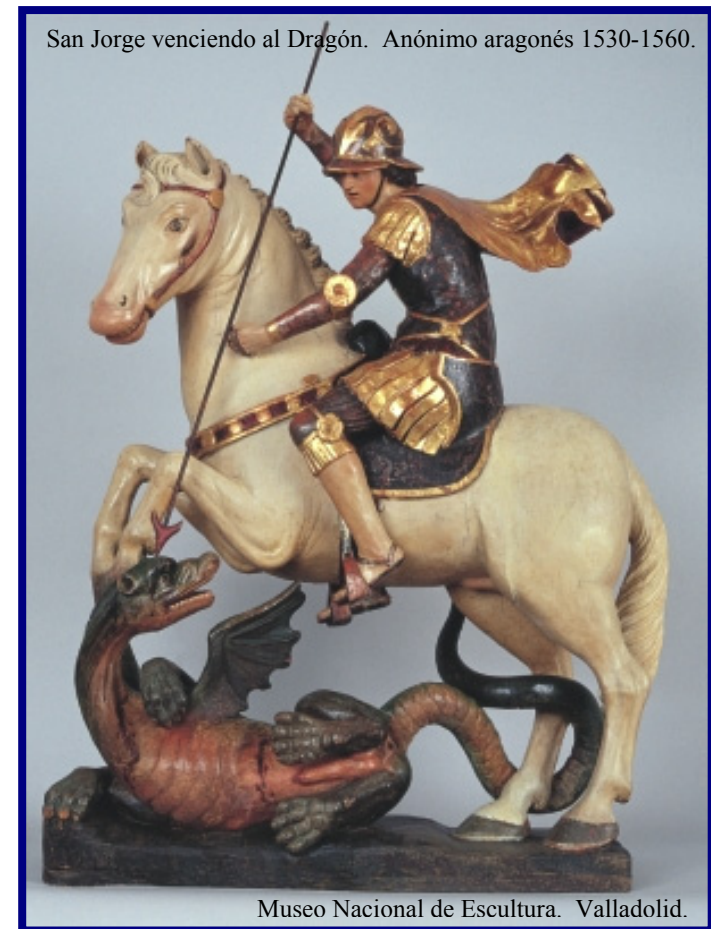
San Jorge venciendo al Dragón. Anónimo aragonés 1530-1560.

Museo Nacional de Escultura. Valladolid.