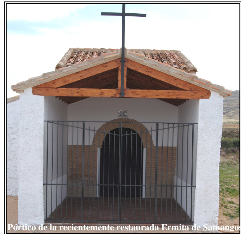
Pórtico de la recientemente restaurada Ermita de Samangos